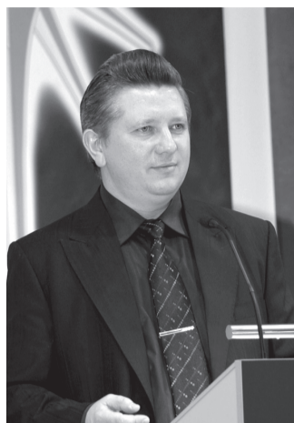
(Окончание. Начало на стр. 1.)

В конечном итоге благо обществу — это благо каждому человеку, каждой организации, в которую наши Проекты будут входить в рамках вопросов, изучаемых и практически реализуемых Системой. Надеюсь, все вы согласитесь, что более важного вопроса, чем Формирование Человека как Личности , или не существует вообще, или адекватную замену ему найти сложно.