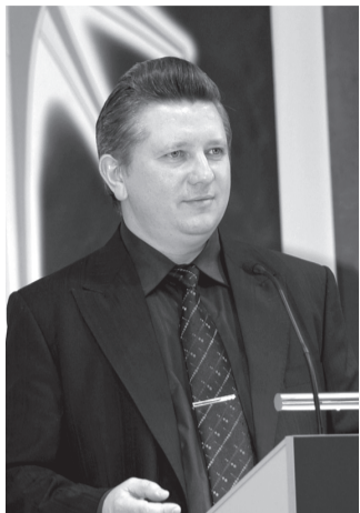
(Окончание. Начало на стр. 1.)

В конечном итоге благо обществу — это благо каждому человеку, каждой организации, в которую наши Проекты будут входить в рамках вопросов, изучаемых и практически реализуемых Системой. Надеюсь, все вы согласитесь, что более важного вопроса, чем Формирование Человека как Личности , или не существует вообще, или адекватную замену ему найти сложно.