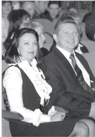
(Окончание. Начало на стр. 1.)

Список можно продолжать, число пороков человека, к сожалению, очень большое. Один из основных выводов, к которому хотелось бы, чтобы все пришли: подобное притягивает подобное, если человек не начинает себя целенаправленно формировать как личность, как человека достойного — у него нет практически никаких шансов на достойные взаимоотношения.